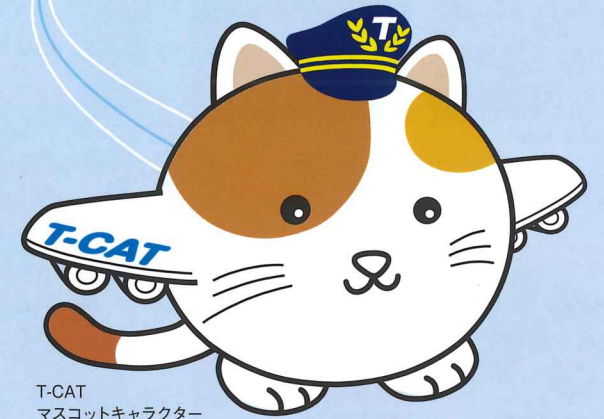
T-CAT マスコットキャラクター 「またたびくん」